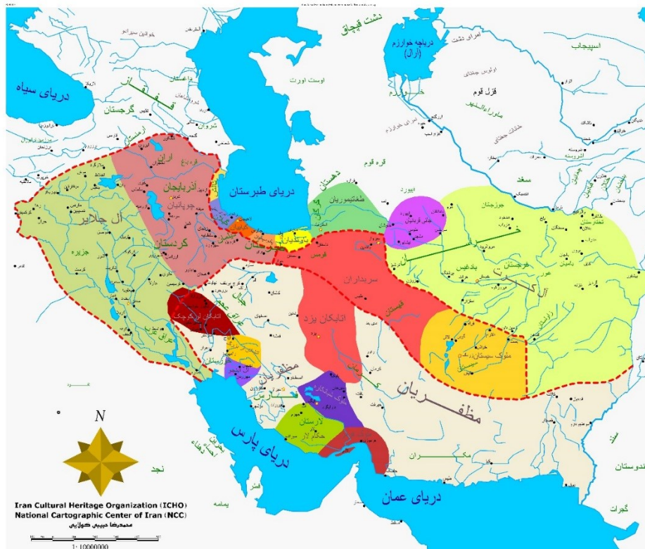
شکل ۱. موقعیت قلمرو اتابکان لر و ارتباط با ملوک دیگر.