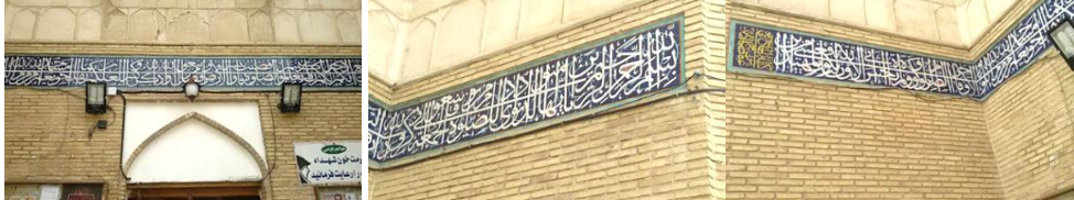
● تصویر (۳)، کتیبه‌ی سر در ورودی مسجد ● تصویر (۴)، کتیبه‌ی سردر ورودی مسجد ● تصویر (۵)، کتیبه‌ی سر در ورودی مسجد