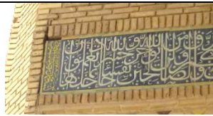
● تصویر (۲۶)، کتیبه شبستان‌های شمالی مسجد.