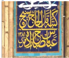
● تصویر (۲)، کتیبه‌ی سر در ورودی مسجد جامع قم.

بورکهارت درباره کتیبه‌نگاری و تزئینات آن معتقد است: «تکرار کتیبه‌های مأخوذ از آیات قرآن کریم روی دیوارهای مساجد و سایر ساختمان‌ها، انسان را یادآور این حقیقت می‌کند که تار و پود حیات اسلامی از آیات قرآنی تنیده شده و از لحاظ معنوی بر قرائت قرآن و نماز و اوراد و اذکاری متکی است که از کتاب آسمانی اخذ شده است». (رضایی، طیبیان، ۱۳۹۷: ۸) بنابراین کاربرد آیات قرآن کریم در تزئینات مسجد به عنوان یک مکان مقدس بر اهمیت جایگاه مفاهیم کلام الهی در